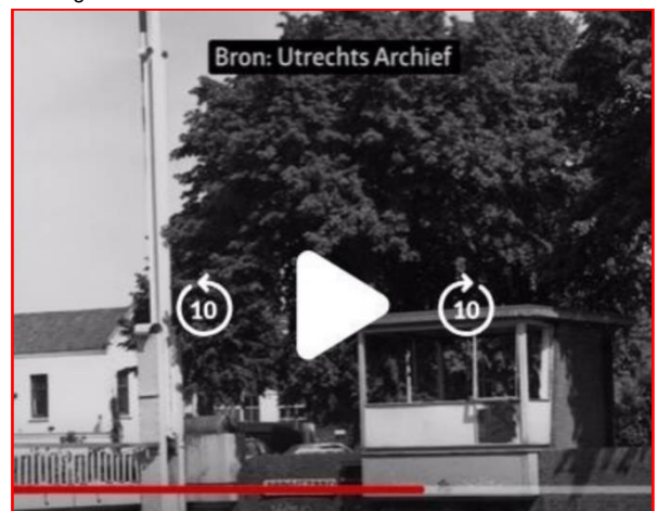
Figuur 2 Historische situatie met werkend brugwachtershuisje