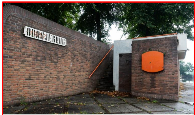
Figuur 1 Huidige situatie

Via deze uitnodiging geeft de gemeente u de mogelijkheid om met een concreet plan te komen voor de invulling van het brugwachtershuisje. De gemeente bepaalt vervolgens op basis van een puntensysteem (zie Uitnodiging) welk voorstel geschikt is voor het brugwachtershuisje. Ook buurtbewoners worden gevraagd te stemmen op hun favoriete plan. In het Ambitiedocument Maatschappelijke Meerwaarde Vastgoed 2021 zijn kaders vastgelegd om meer ruimte voor maatschappelijke initiatieven te creëren.