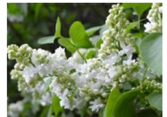
Syringa vulgaris 'Miss Ellen Willmott' - Sering