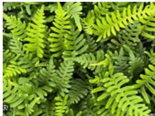
Polypodium vulgare Eikvaren (vaste plant)