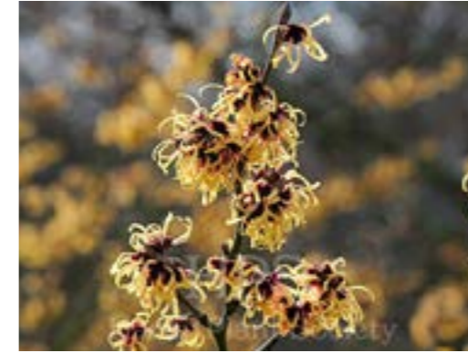
Hamamlis x intermedia 'Allgold' Toverhazelaar