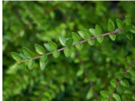
Lonicera nitida 'Elegant' Struikkamperfoelie