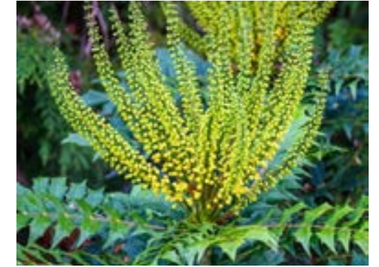
Mahonia x media 'Winter Sun' Mahoniestruik