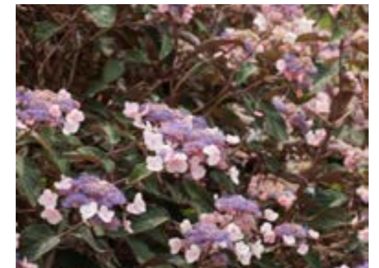
Hydrangea aspera 'Haopr012' HOT CHOCOLATE - Fluweelhortensia