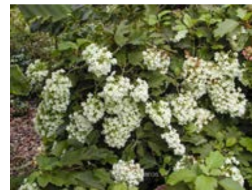
Hydrangea quercifolia 'Brido' Eikenbladhortensia