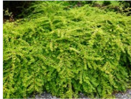
Symphoricarpos x chenaultii 'Brain de Soleil' Basterd Sneeuwbes