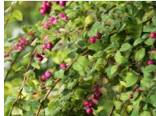
Symphoricarpus x chenaultii 'Hancock' Basterd Sneeuwbes