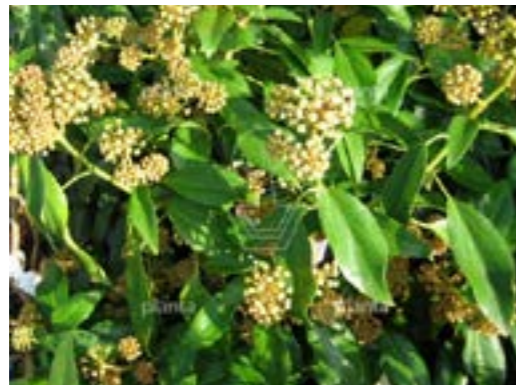
Hedera colchica 'Fall Favourite' Struikklimop