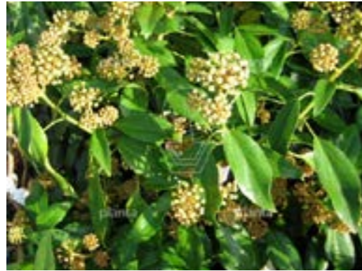
Hedera colchica 'Fall Favourite' Struikklimop