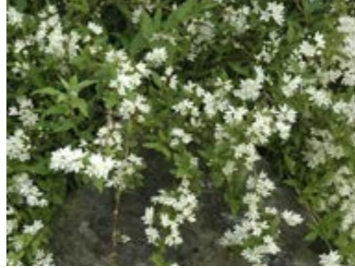
Deutzia gracilis 'Nikko' Bruidsbloem