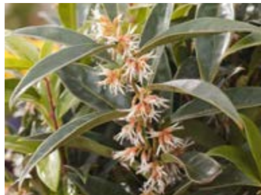
Sarcococca hookeriana var 'Humilis' Vleesbes