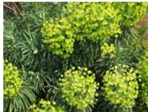
Euphorbia characias Wolfsmelk (vaste plant)