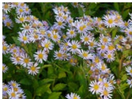
Aster ageratoides 'Asran' Herfstaster (vaste plant)