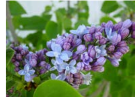
Syringa vulgaris 'Carpe Diem' (='Evert de Gier') - Sering