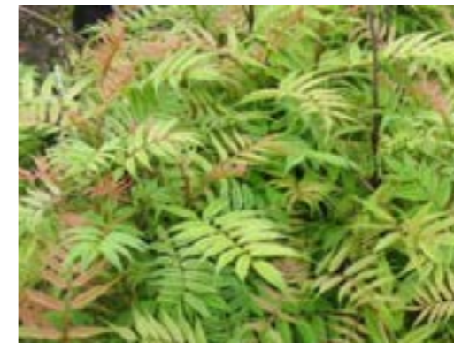
Sorbaria sorbifolia 'Sem' Lijsterbesspirea