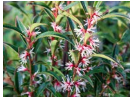
Sarcococca hookeriana 'Purple Stem' Vleesbes