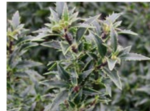
Ilex aquifolium 'Myrtifolia' Hulst