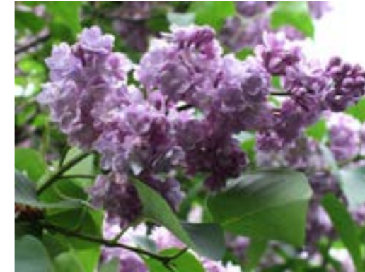
Syringa vulgaris 'Michel Buchner' Sering