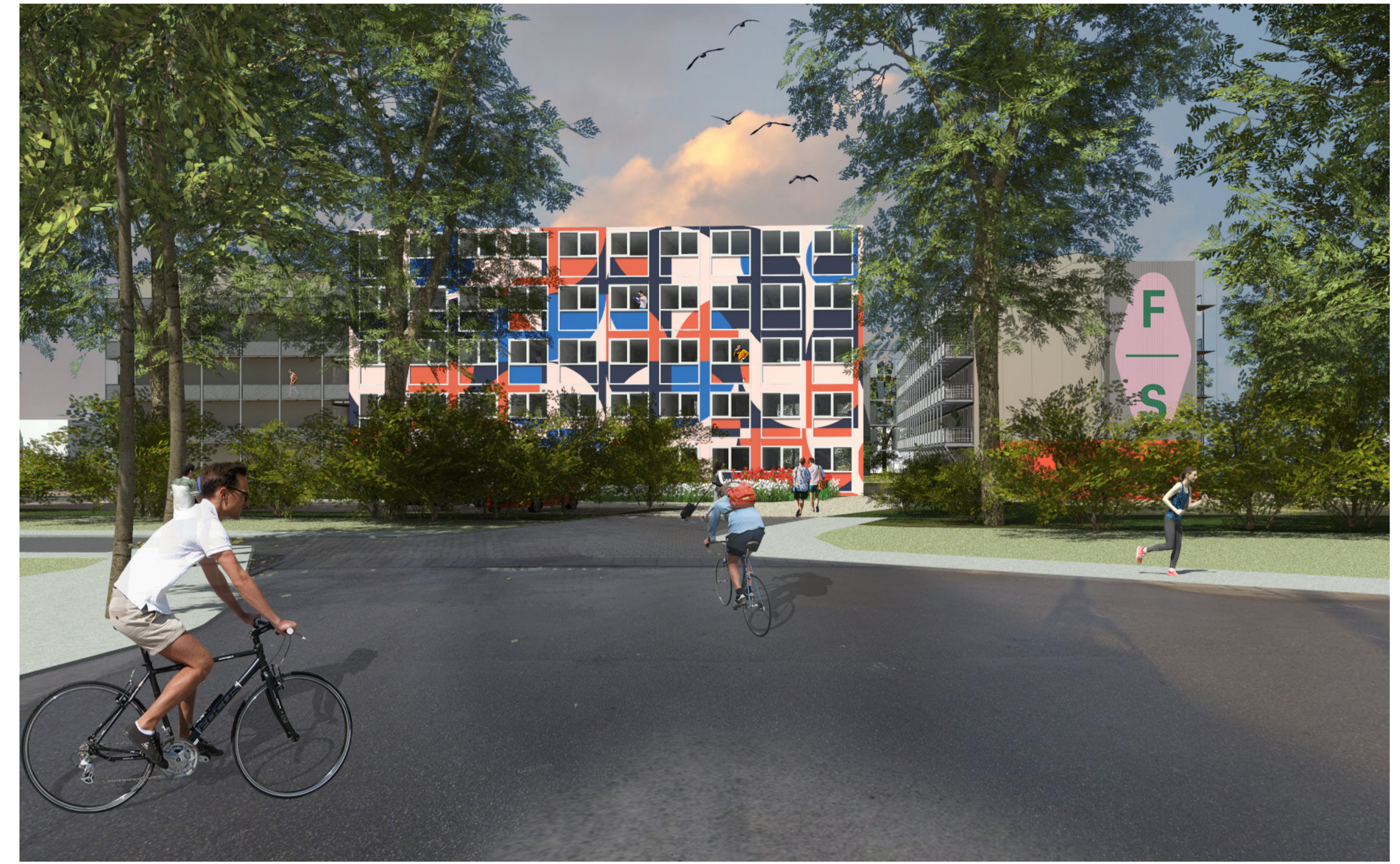
Entree vanaf Pagelaan