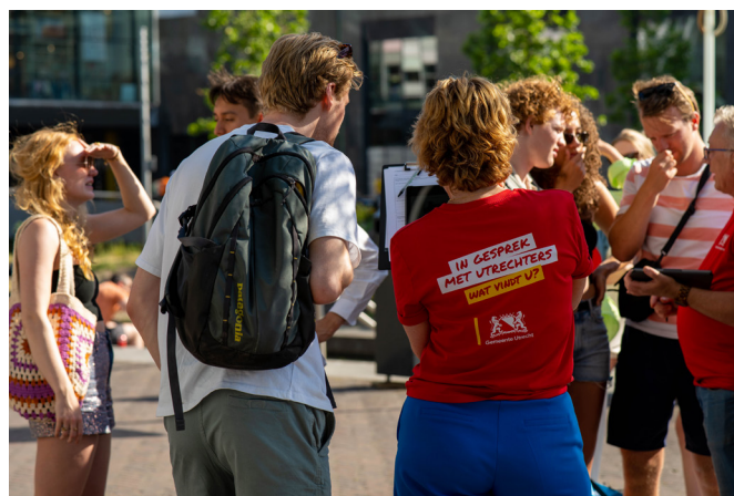
Tijdens de straatinterviews zijn 553 Utrechters gesproken over wat zij belangrijk vinden voor de toekomstige inrichting van de stad.